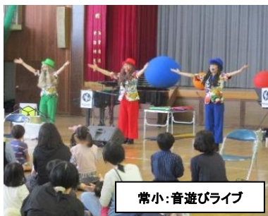
常小:音遊びライブ