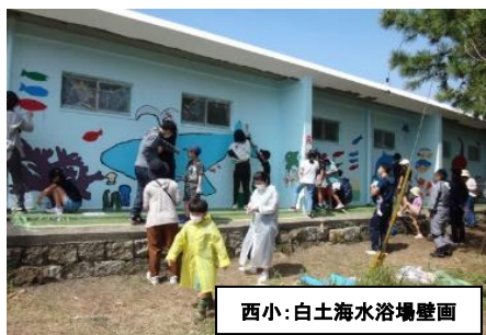
西小:白土海水浴場壁画