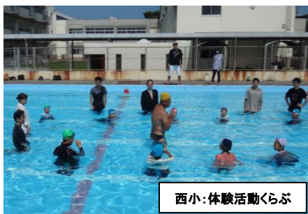
西小:体験活動くらぶ