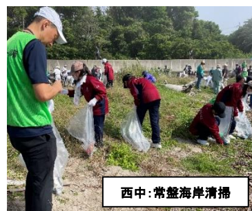
西中:常盤海岸清掃