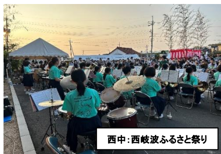
西中:西岐波ふるさと祭り