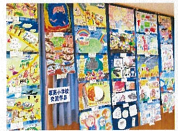
展示された厚南小児童の作品

校区内にある宇部総合支援学校とは、定期的に様々な交流活動をとおして、障害のある子どもと障害のない子どもの相互理解を図っています。11/11(土)に開催された「うべそうまつり」では、本校児童の作品を出品し、まつりに華を添えました。また、1学期に続き、来校した宇部総合支援学校の子どもと2・3・5年生との交流会が行われ、和やかな雰囲気のもと、レクリエーション等を楽しんでいました。