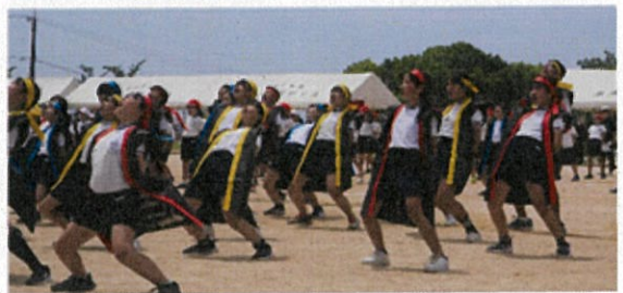
最上級生として、全力で「厚南エール」を叫ぶ6年生！

たくさんの保護者や地域の皆様にご来校いただき、温かい励ましの声を掛けてくださり、改めて厚南校区のつながりの強さを感じたところです。ご参観いただいた皆様、本当にありがとうございました。