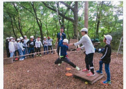
<5年宿泊学習> 仲間との絆を強めたアクティビティ

高学年になると、宿泊を伴う校外学習へとレベルアップされ、5年生が9月に国立山口徳地青少年自然の家で宿泊学習、6年生が10月に広島方面（原爆ドーム、厳島神社等）に修学旅行へ行ってきたところです。寝食を共にする貴重な集団生活を通して友達との絆を深め、体験学習を通して見聞を広めることができ、一生の思い出に残るかけがえのない学びができたことと思います。