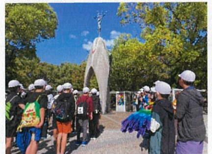
<6年修学旅行 誓いの言葉> 「平和で幸せな未来にすることを誓います！（抜粋）」

「原爆の子の像」の前に真剣なまなざしで整列し、平和集会を行った6年生。子どもたちの平和への祈りをのせた「誓いの言葉」や「歌（平和のたね）」は、園内に響き渡り、他校の修学旅行生や外国の方たちも足を止め、見入ってくださいました。また、全校児童に呼びかけ、平和への思いをギュッと詰め込んで制作した千羽鶴も捧げることができ、最上級生としての役割をしっかりと果たしてくれました。さすが、厚南小自慢の6年生です！