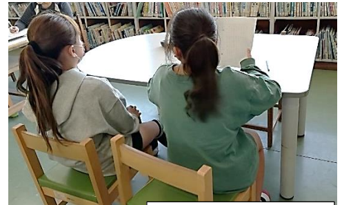
代読の練習中です。

今年初めて、各クラス代表の読書感想文を給食時間に読みました。書いてくれた人自身が読んだり、図書委員が代読したりして、全校のみんなに紹介しました。