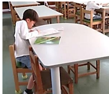
中間タイムや昼休みに、読書ビンゴを書いています。

各マスには、読む本の種類が指定してあり、読んだ本の題名と読み終わった日にちを書くようになっていきます。