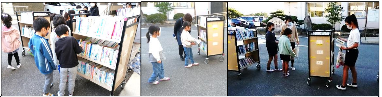
読みたい本をじっくり一人でさがしたり、友達と話をしながら決めたり、時には図書館の方に読みたい本をさがしてもらうこともあります。

11月8日、宇部市移動図書館「青空号」が原小学校に来てくださいました。天気が良かったので、青空のしたでの移動図書館の貸し出しとなりました。風が吹くと肌寒い時もありましたが、みんな元気に楽しそうに本を選んでいました。