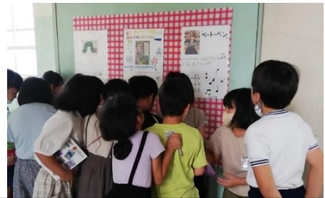
クイズの問題をみにきています。